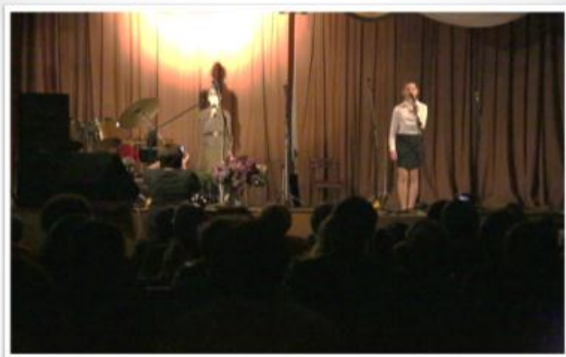
Диалог «Не суждено подружками нам стать», показанный на концерте 9 мая в зрительном зале ДК п. Сорговый.

Хочется отметить ещё одно мероприятие, в котором приняла участие Манычская ЦБ совместно с СДК п. Сорговый. Это акция «Свеча памяти». У памятника павшим воинам в п. Сорговый в день начала ВОВ проведён митинг, на котором присутствовали школьники и жители посёлка. Прозвучал проникновенный рассказ о страшных днях начала войны. Ребята читали стихи. Участники митинга почтили память павших минутой молчания, возложили цветы к памятнику и зажгли свечи.