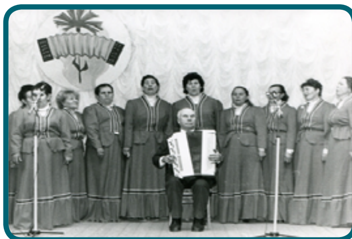
1988ГОД . 3-Й ОБЛАСТНОЙ СМОТР ХУДОЖЕСТВЕННОЙ САМОДЕЯТЕЛЬНОСТИ