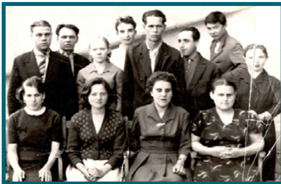
Первый выпуск школы ШРМ 1965год.