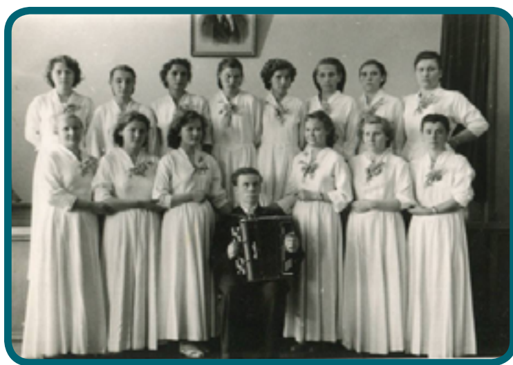
1957 ГОД . ХОРОВОЙ КОЛЛЕКТИВ