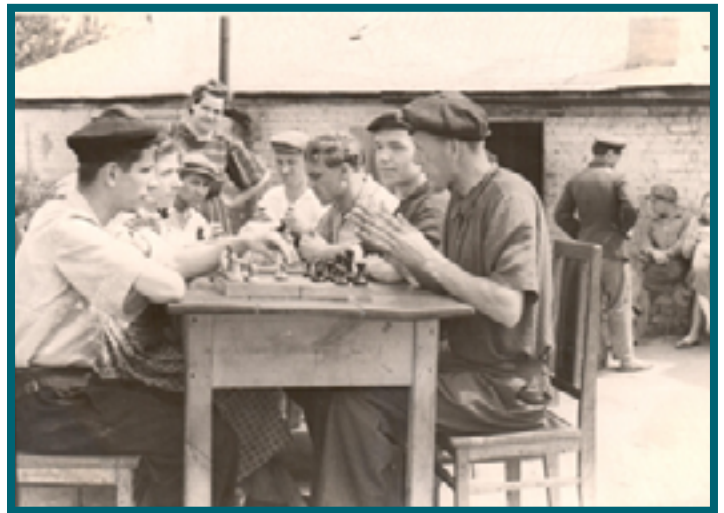
Во время обеденного перерыва

общественных началах 38 лет. Делегат XIII съезда ВОС. Являлась членом Центрального правления ВОС с 1975 года по 1981 год. Занесена в Книгу Почета ЦП ВОС, РОО ВОС и города Красного Сулина. Неоднократная чемпионка по шашкам и шахматам области и города Красный Сулин. Награждена Орденом «Знак Почета», Знаком «Отличник физической культуры и спорта», Памятной медалью Советского фонда мира, значком «Отличник ВОС», знаком «За заслуги перед ВОС III и II степени», Почетными грамотами ЦП ВОС, РОО ВОС и г. Красного