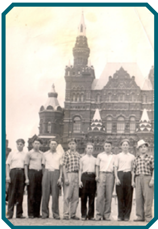
1960 год. г. Москва. Первая сборная по классической борьбе