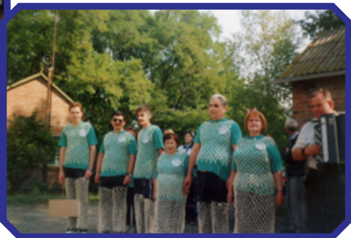
Конкурс «А-ну ка, восоцы»