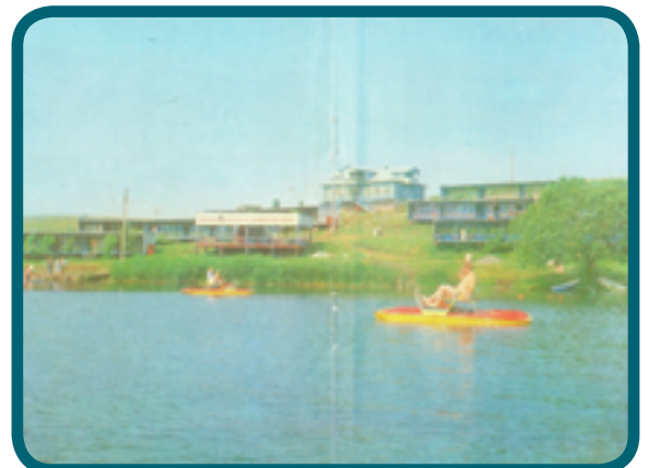
База отдыха «Зеленая горка» построенная в 1979 году