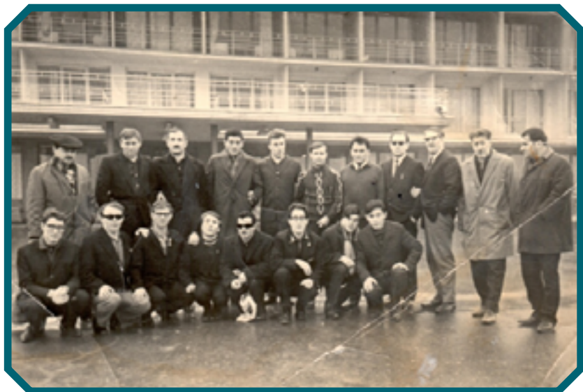
1968 год Грузия Сборная Ростовской области по классической борьбе

ПЕРВЫЙ: Хорошие люди работали и работают у нас в организации и без их помощи трудно представить работу нашей МО ВОС, я хочу их назвать: