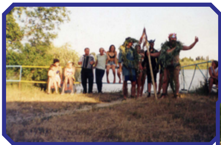
Праздник « Нептуна» база отдыха УПП г.Новочеркаска